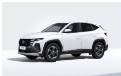
Atlas White (SAW) erikoisväri

(Musta kattoväri ei saatavilla Comfort-varustetason tai Panorama Sunroof -lasikattoluukun yhteydessä.)