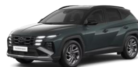
Cypress Green (T2P) Helmiäisväri Cypress Green / Musta katto (T20)