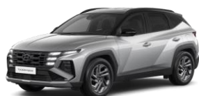
Shimmering Silver (R2T) Metalliväri tai Shimmering Silver/ Musta katto (R24)