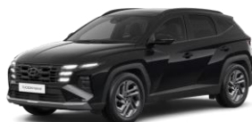
Abyss black (A2B) Helmiäisväri