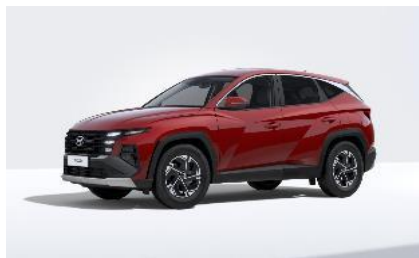
Ultimate red (R1P) Helmiäisväri