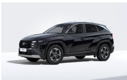
Abyss black (A2B) Helmiäisväri