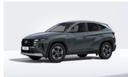
Cypress Green (T2P) Helmiäisväri