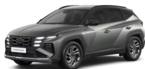
Pine Green Matta (RB2) tai Pine Green Matta / musta katto (RB0)