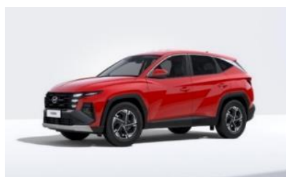
Engine Red (JHR) Solid Veloitukseton väri