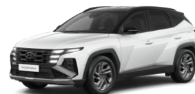
Serenity White (W6H) Helmiäisväri tai Serenity White / Musta katto (W60)