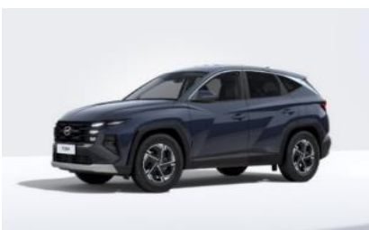
Sailing Blue (U2P) Metalliväri