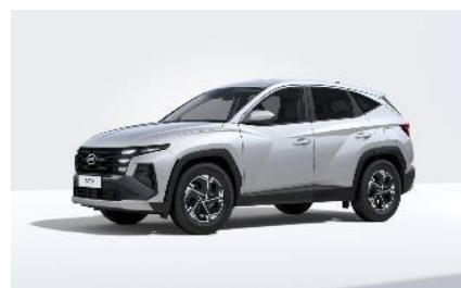
Shimmering Silver (R2T) Metalliväri