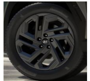
Comfort 17" kevytmetallivanteet 215/65/R17 renkaat