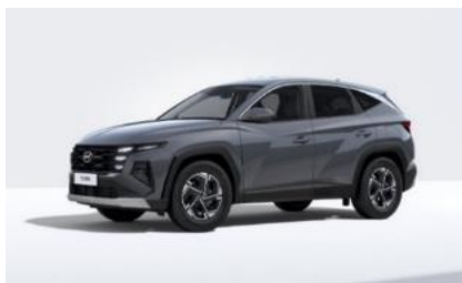
Ecotronic Grey (PE2) Helmiäisväri