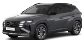
Ecotronic Grey (PE2) Helmiäisväri Ecotronic Grey / Musta katto (PE0)