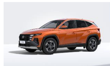
Jupiter Orange (PL2) Metalliväri