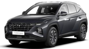
Dark Knight (YG7) -helmiäisväri