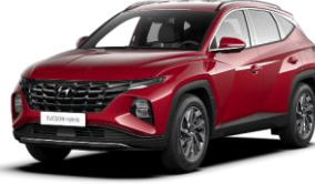
Sunset Red (WR6) -helmiäisväri