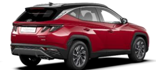
Sunset Red/ Phantom Black -katto (WRT)