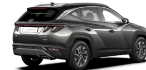
Amazon Gray/ Phantom Black -katto (A51)