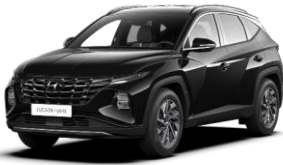
Phantom Black (PAE) -helmiäisväri