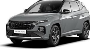
Shadow Gray (TKG) -erikoisväri (Saatavilla vain N Line -malliin)