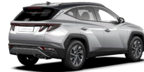
Shimmering Silver/ Dark Knight -katto (R2C)