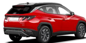
Engine Red/ Phantom Black -katto (JH1)