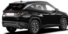
Phantom Black/ Dark Knight -katto (PA9)