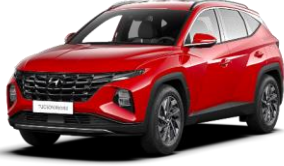
Engine Red (JHR) -vakioväri ilman lisähintaa