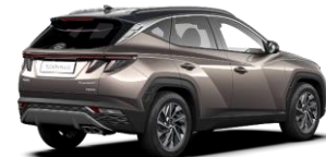
Silky Bronze/ Dark Knight -katto (B6C)