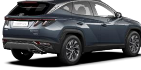
Teal/ Dark Knight -katto (TG1)