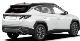
Serenity White (W6E) -helmiäisväri / Phantom Black -katto