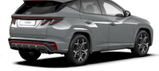
Shadow Gray/ Phantom Black -katto (TK1) (Saatavilla vain N Line -malliin)