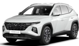
*Atlas White (SAW) -erikoisväri