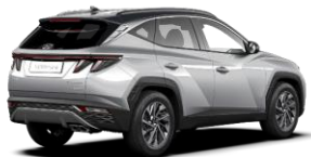
Shimmering Silver / Dark Knight -katto (R2C)