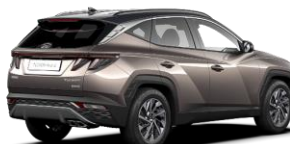
Silky Bronze / Dark Knight -katto (B6C)