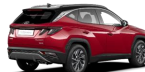
Sunset Red / Phantom Black -katto (WRT)