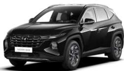
Phantom Black (PAE) -helmiäisväri