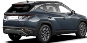
Teal / Dark Knight -katto (TG1)