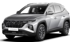
Shimmering Silver (R2T) -metalliväri