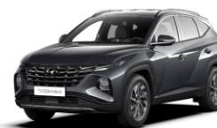
Dark Knight (YG7) -helmiäisväri