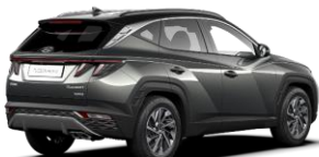
Amazon Gray / Phantom Black -katto (A51)