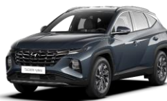
Teal (TG8) -metalliväri