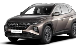
Silky Bronze (B6S) -metalliväri