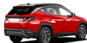
Engine Red / Phantom Black -katto (JH1)