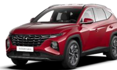
Sunset Red (WR6) -helmiäisväri