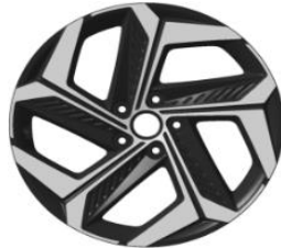
19"alumiinivanteet 235/50/R19 renkaat