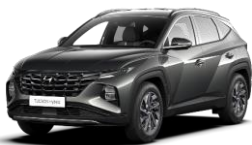
Amazon Gray (A5G) -metalliväri