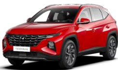
Engine Red (JHR) -vakioväri ilman lisähintaa