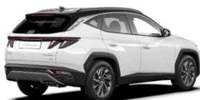
*Atlas White (SAW) -erikoisväri / Phantom Black -katto (PY1)