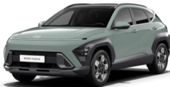
„Mirage Green“ pilkai melsva (RRR) – nemokamai