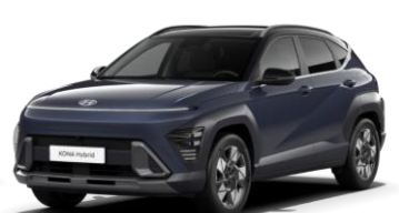
„Denim Blue“ tamsiai mėlyna perlamutrinė (TN0) / juodas stogas