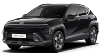
„Abyss Black“ juoda perlmutrinė (AZB)

„Mirage Green“ pilkai melsva – nemokamai 0 € Metalo blizgesio ir perlmutrinė spalva 550 €