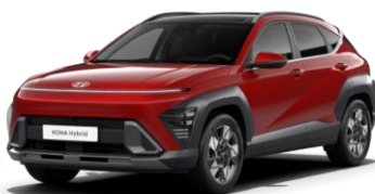
„Ultimate Red“ raudona metalo blizgesio (R2P)