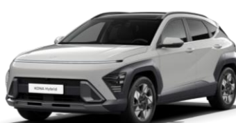
„Cyper Grey“ sidabrinė metalo blizgesio (C5G)