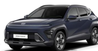
„Denim Blue“ tamsiai mėlyna perlmutrinė (TN6)