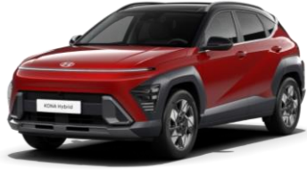
„Ultimate Red“ raudona metalo blizgesio (R20) / juodas stogas