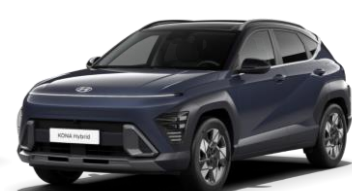
„Denim Blue“ tamsiai mėlyna perlamutrinė (TN0) / juodas stogas