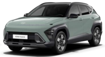
„Mirage Green“ pilkai melsva (RR0) / juodas stogas