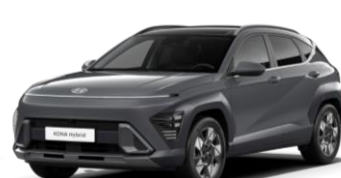
„Ecotronic Gray“ pilka perlmutrinė (PE2)