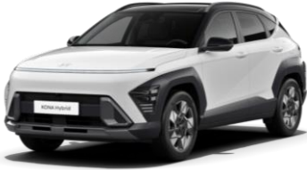
„Atlas White“ balta (SA0) / juodas stogas

„Phantom Black“ juodas stogas „Phantom Black“ juodas stogas 590 €