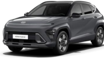
„Ecotronic Gray“ pilka perlamutrinė (PE0) / juodas stogas