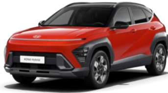
„Soultronic Orange“ oranžinė perlamutrinė (SO0)* / juodas stogas