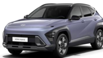
„Meta Blue“ mėlyna perlamutrinė (PM0)* / juodas stogas