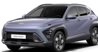
„Meta Blue“ mėlyna perlmutrinė (PM2)*