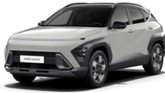
„Cyber Grey“ sidabrinė metalo blizgesio (CS0) / juodas stogas