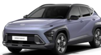
Meta Blue, перламутр (PM0) / черная крыша*