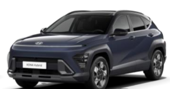
Denim Blue, перламутр (TN0) / черная крыша