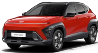
Soultronic Orange, перламутр (SO0) / черная крыша*