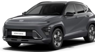
Ecotronic Gray, перламутр (PE0) / черная крыша