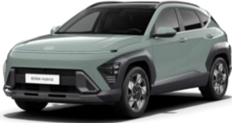
Mirage Green, сплошной (RRR)