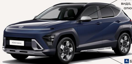
3. Крышки зеркал заднего вида, матовый алюминий.