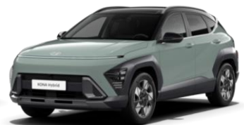
Mirage Green (RR0) / черная крыша