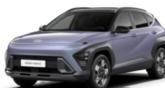
Meta Blue, перламутр (PM0) / черная крыша*