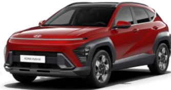
Ultimate Red, металл (R2P)