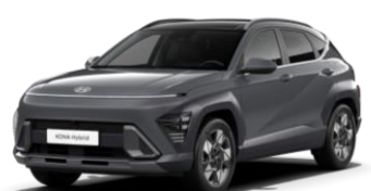
Ecotronic Gray, перламутр (PE2)