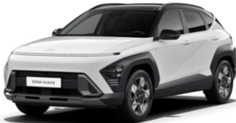
Atlas White (SA0) / черная крыша

Phantom Black — черная крыша Phantom Black — черная крыша 590 €