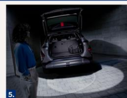
5. Светодиодные фонари багажника и задних дверей.