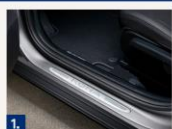
1. Защита порогов из нержавеющей стали.