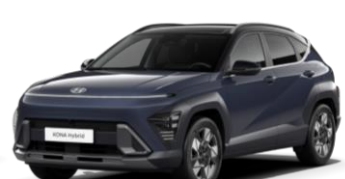
Denim Blue, перламутр (TN0) / черная крыша