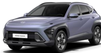
Meta Blue, перламутр (PM2)*