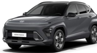
Ecotronic Gray, перламутр (PE0) / черная крыша