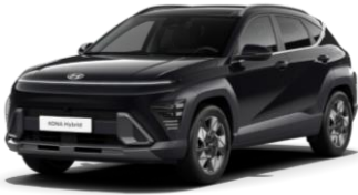
Abyss Black, перламутр (A2B)

Mirage Green, сплошной — Бесплатно Цвет «металлик» или «перламутр» 0 € 550 €