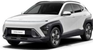
Atlas White (SAW)