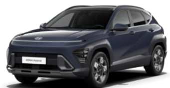
Denim Blue, перламутр (TN6)