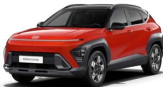
Soultronic Orange, перламутр (SO0) / черная крыша*