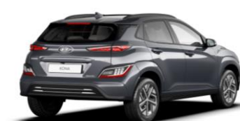
Dark Knight (YG7) – perlmutra