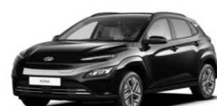
Phantom Black (PAE) – perlmutra