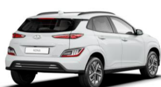
Atlas White (SAW) – nemetāliska