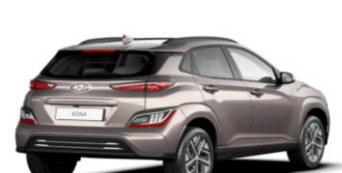
Silky Bronze (B6S) – metāliska