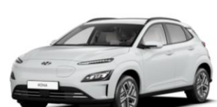
Serenity White (A2B) – perlmutra