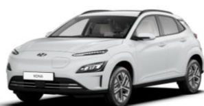
Atlas White (SAW) – nemetāliska