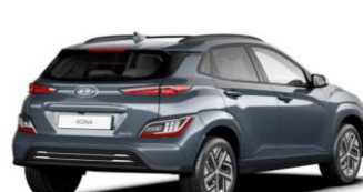
Dark Teal (TG8) – metāliska