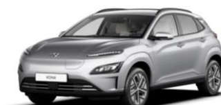
Shimmering Silver (R2T) – perlmutra