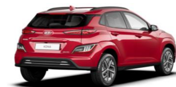
Sunset Red (WR6) – perlmutra