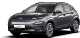
Dark Knight (YG7) – perlmutra