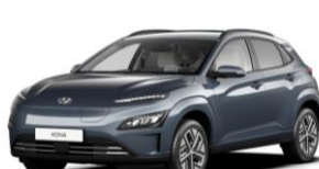
Dark Teal (TG8) – metāliska