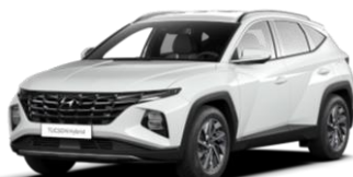
Atlas White (SAW)