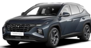
Dark Teal - metāliska Abyss Black - jumts (TG0)