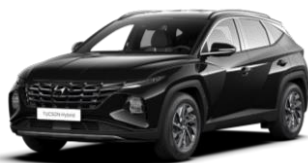
Abyss Black (A2B)