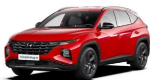
Engine Red (JHR)