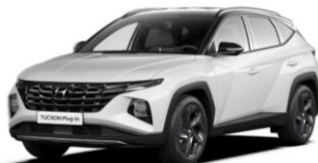
Serenity White - perlamutra Abyss Black - jumts (W60)