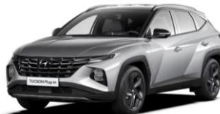
Shimmering Silver (R2T) metāliska