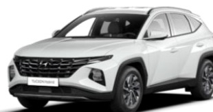
Serenity White (W6H)