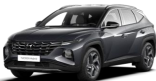
Dark Knight Gray - perlamutra Abyss Black - jumts (YG0)