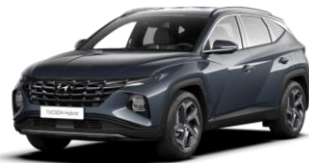
Dark Teal (TG8) metāliska