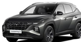
Shimmering Silver - metāliska Abyss Black - jumts ( R24)