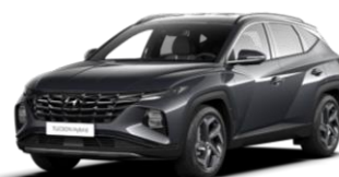
Dark Knight Gray (YG7)