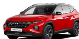
Engine Red (JH0) Abyss Black - jumts