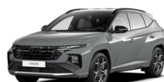
Shadow Gray (TKG)*