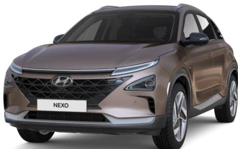
Copper (R3C) – metāliska