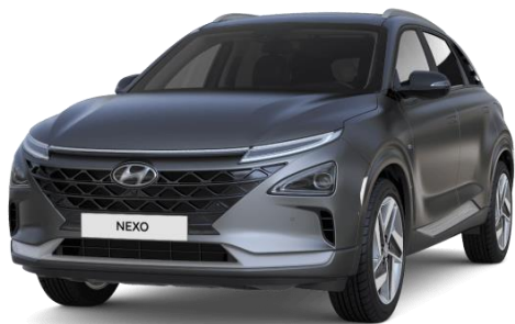
Titanium Grey (Y3G) – matēta