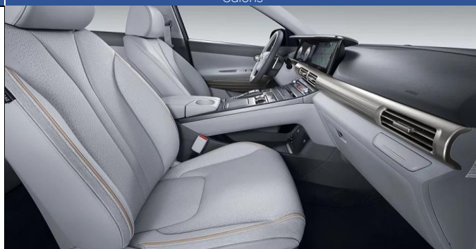
Stone Gray / Black (SRX)

Hyundai patur tiesības mainīt cenu un specifikācijas bez iepriekšēja brīdinājuma.