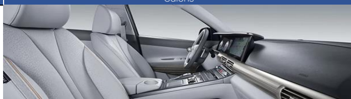
Stone Gray / Black (SRX)