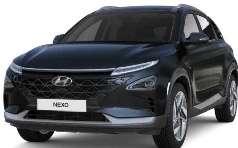
Ocean Indigo (P58) – perlamutra (bez papildu maksas)