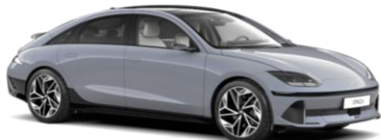
Transmission Blue perlamutra (NY9)