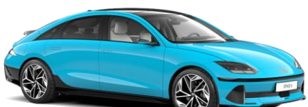
Byte Blue perlamutra (UCB)