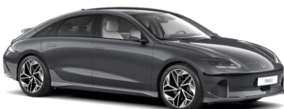
Nocturne Grey matēta (T9M)