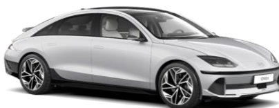
Curated Silver metāliska (R9S)