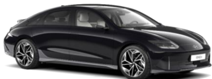
Abyss Black perlamutra (A2B)