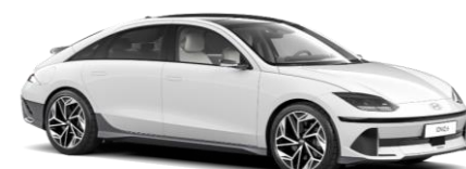
Serenity White perlamutra (W6H)

Praksē faktiskais nobraucamais attālums mainās atkarībā no braukšanas stila, ātruma, komforta/sekundāro patērētāju izmantošanas, ārā temperatūras, pasažieru skaita/papildu kravas un topogrāfijas. Katram automobilim norādīts aptuvenais nobraucamais attālums, kuru vidēji gadā, domājams, sasniegs 80% mūsu klientu. Braucot ar lielu ātrumu un ziemā zemā temperatūrā, nobraucamais attālums var ievērojami samazināties. Maksimālā uzlāde var būt ievērojami zemāka par maksimālo uzlādes stacijas ātrumu. Piemēram, nebūs iespējams uzlādēt ar 350 kW ātrumu, pat ja uzlādes stacija spēj nodrošināt 350 kW. Akumulatora stāvoklis, akumulatora temperatūra un ārējā temperatūra var ietekmēt uzlādes ātrumu.