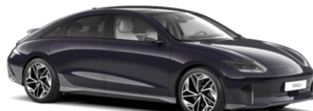
Biophilic Blue perlamutra (XB9)