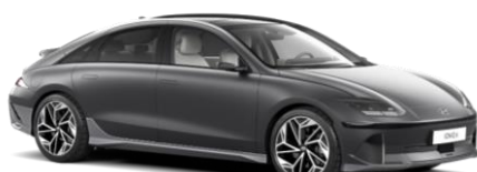
Nocturne Grey metāliska (T2G)