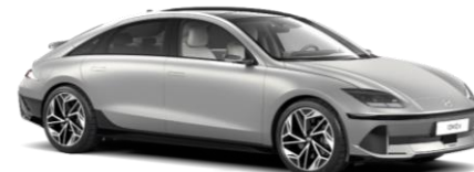
Gravity Gold matēta (W3T)