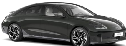
Digital Green perlamutra (RG9)