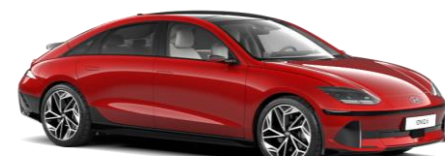
Ultimate Red metāliska (R2P)