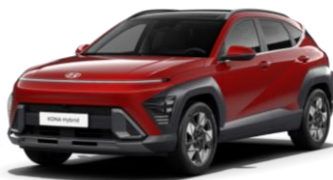
Metallikvärv Ultimate Red (R2P)