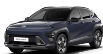
Pärlmuttervärv Denim Blue (TN0) / must katus