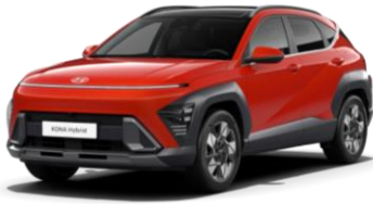
Pärlmuttervärv Soultronic Orange (SOP)*