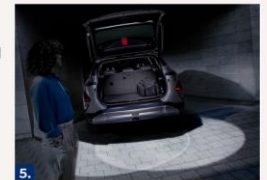
5. Pakiruumi ja tagaluugi LED-valgustus.