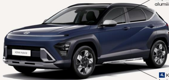
3. Küljepeeglite korpused, harjatud alumiinium.