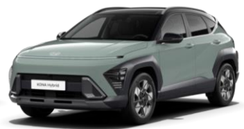
Ttavärv Mirage Green (RR0) / must katus