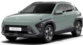
Ttavärv Mirage Green (RRR)