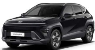
Pärlmuttervärv Abyss Black (A2B)

Tavavärv Mirage Green - tasuta 0 € Metallik- ja pärlmuttervärvid 550 €