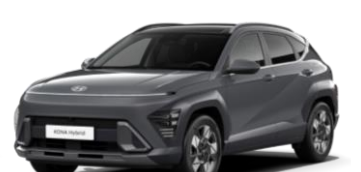
Pärlmuttervärv Ecotronic Gray (PE2)