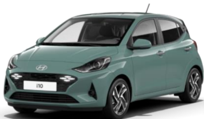
Mangrove Green (MG2) – сплошной цвет

Металлик или перламутровый цвет 390 евро