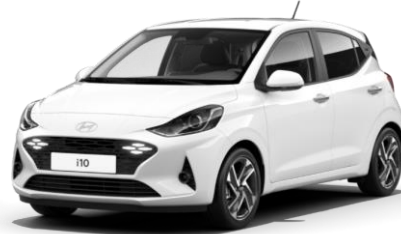
Atlas White (SAW) – специальный цвет