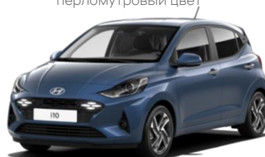
Vibrant Blue (UC3) – металлик