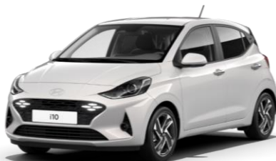
Lumen Grey Pearl (Y3H) – перламутровый