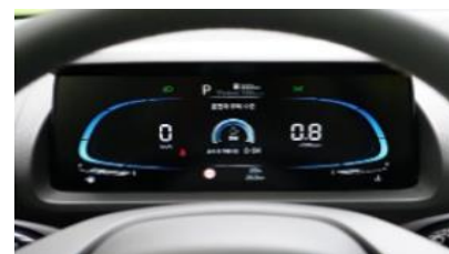
Полностью цифровая 4,2" приборная панель с ЖК-экраном