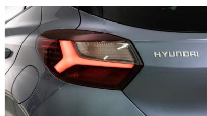
Задние светодиодные фары