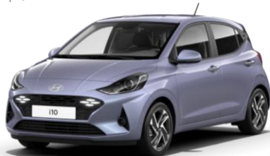
Meta Blue (PM2) – перламутровый цвет