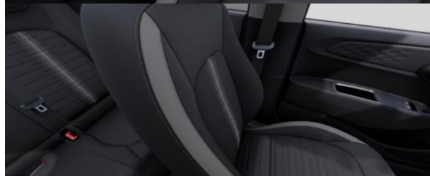
Черная приборная панель Внутренняя отделка из черной ткани