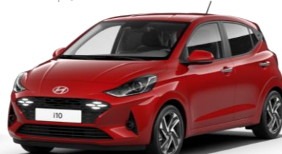
Dragon Red (WR7) – перламутровый цвет