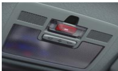
Система автоматического вызова экстренных служб eCall