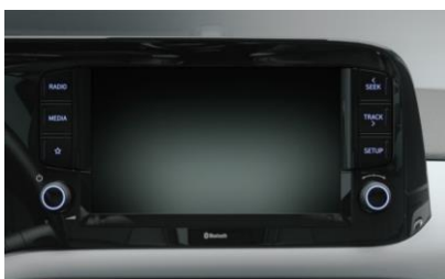
8" цветной сенсорный экран с навигацией

5 ЛЕТ Гарантия неограниченная по пробегу