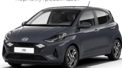
Aurora Grey (A7G) – перламутровый цвет