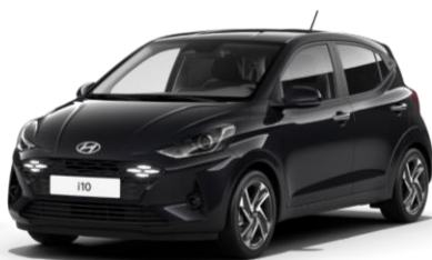
Phantom Black (X5B) – перламутровый цвет