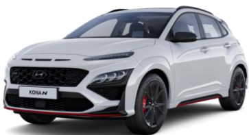
Sonic Blue (PYU) erikoisväri