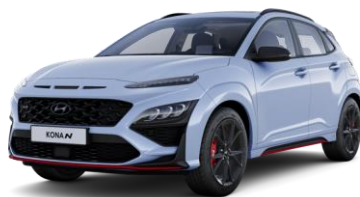
Performance Blue (SFB) erikoisväri