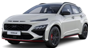
Cyber Gray (C5G) metalliväri