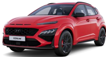
Ignite Flame (WR7) ilman lisähintaa