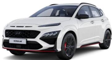
Atlas White (SAW) erikoisväri

Metalli-, helmiäis- tai erikoisvärin autoveroton ovh 500 € + arvioitu autovero 189 € = ovh 679 €