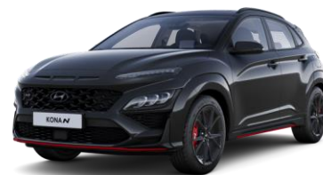
Abyss Black (A2B) helmiäisväri Phantom Black (MZH) helmiäisväri