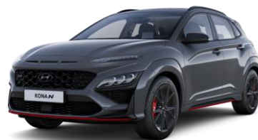
Ecotronic Gray (PE2) helmiäisväri Dark Knight (Y7G) helmiäisväri