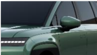
Ionosphere Green (NH5) helmiäisväri