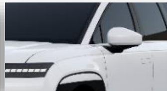
Serenity White (W6H) helmiäisväri