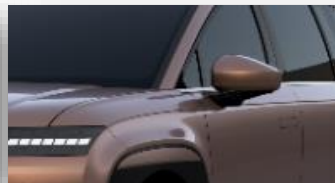
Sunset Brown (R5P) helmiäisväri