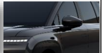
Abyss Black (A2B) helmiäisväri