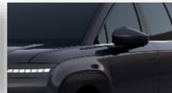
Biophilic Blue (XB9) helmiäisväri