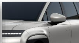
Gravity Gold (W3T) mattaväri

Sähköautojen kulutuksen ja toimintamatkan mittaustavan (WLTP) ilmoitetut arvot on tarkoitettu eri automallien väliseen vertailuun. Ne perustuvat keskiarvoa jättittelevään WLTP (Worldwide harmonised Light-duty Vehicles Test Procedure) -mittaukseen, eivätkä ne kuvaa auton kulutusta kaikissa olosuhteissa. Auton kulutukseen ja toimintamataan sähköllä vaikuttavat muun muassa lämpötila, keli- ja ajo-olosuhteet, kuljettajan ajotapa, ajonopeus, lisävarusteet, rengastus sekä auton kuormaus. Kylmissä olosuhteissa sähköauton toimintamatta lyhentyä huomattavasti ja hetkellisesti kulutus voi olla jopa moninkertainen ilmoitettuun WLTP lukemaan verrattuna.