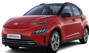
Sunset Red -helmiäisväri / Phantom Black -katto (WRT)