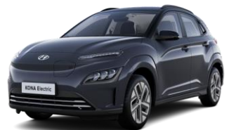
Dark Knight Gray -helmiäisväri / Phantom Black -katto (YG1)