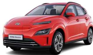
Engine Red (JHR) -erikoisväri