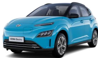
Dive In Jeju / Phantom Black -katto (UT1)