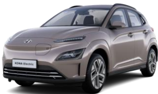
Silky Bronze (B6S) -metalliväri