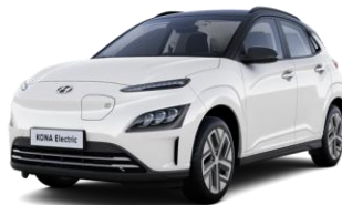
Serenity White -helmiäisväri / Phantom Black -katto (W6E)