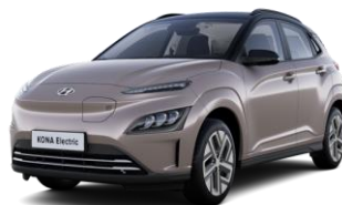
Silky Bronze -metalliväri / Phantom Black -katto (B6A)