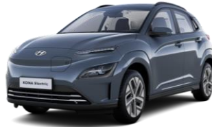
Dark Teal (TG8) -metalliväri