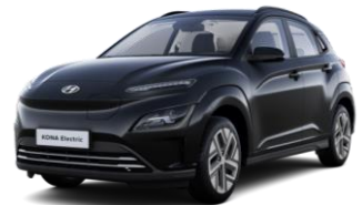
Phantom Black (PAE) -helmiäisväri