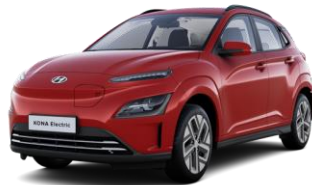
Sunset Red (WR6) -helmiäisväri