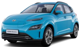
Dive In Jeju (UTK) -veloitukseton väri