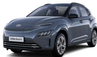
Dark Teal -metalliväri / Phantom Black -katto (TG1)