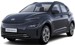
Dark Knight (YG7) -helmiäisväri