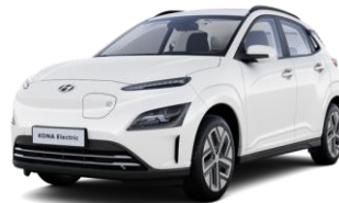
Atlas White (SAW) -erikoisväri