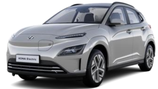
Shimmering Silver (R2T) -helmiäisväri