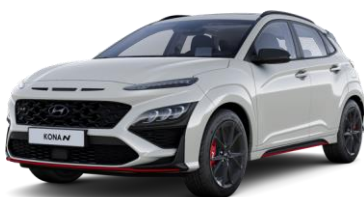
Cyber Gray (C5G) metalliväri