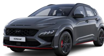
Dark Knight (Y7G) helmiäisväri