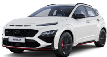
Atlas White (SAW) erikoisväri

Metalli-, helmiäis- tai erikoisvärin autoveroton ovh 500 € + arvioitu autovero 189 € = ovh 679 €