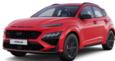
Ignite Flame (WR7) ilman lisähintaa