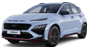
Performance Blue (SFB) erikoisväri