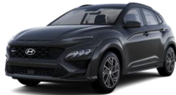
Phantom Black (MZH) -helmiäisväri