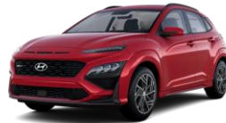
Pulse Red (Y2R) -helmiäisväri