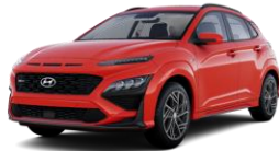
Ignite Flame Red (C5G) -erikoisväri