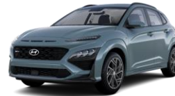
Misty Jungle (Y7H) -helmiäisväri