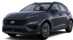
Dark Knight (YG7) -helmiäisväri