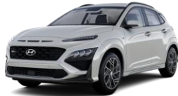
Cyber Gray (C5G) -metalliväri

Metalli, helmiäis- tai erikoisväri (Hinta ilman autoveroa 500 € arvioitu autover € 42-136) SHV € 532-626 Phantom Black musta katto (Hinta ilman autoveroa 500 €, arvioitu autovero €50 - €161) SVH € 630 - € 741