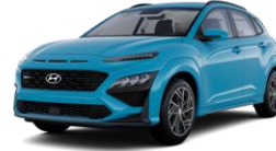
Dive In Jeju (UTK) -veloitukseton väri