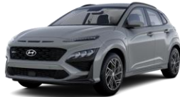
Galactic Gray (R3G) -metalliväri