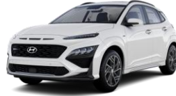
Atlas White (SAW) -erikoisväri