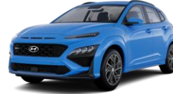
Surf Blue (V7U) -metalliväri