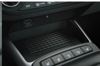
Langaton matkapuhelimen lataus