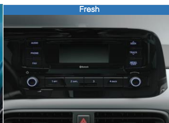
Radio ja 3,8" mustavalkonäyttö