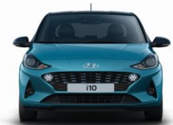
Leveys 1680 mm