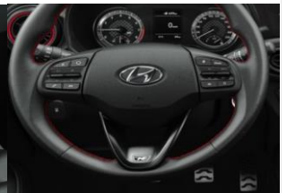
Race car desing sisusta