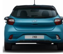
Tavaratila VDA 252–1050 l