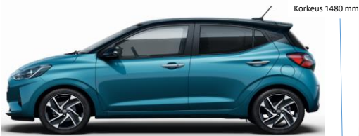
Korkeus 1480 mm