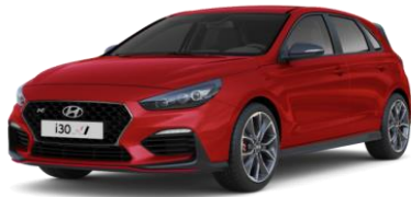
Engine Red (JHR) perusväri