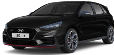
Phantom Black (PAE) helmiäisväri