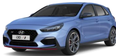
Performance Blue (XFB) erikoisväri