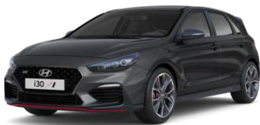
Micron Grey (Z3G) metalliväri