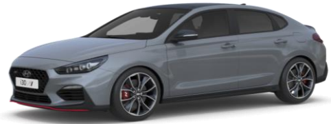
Shadow Grey (TKG) erikoisväri

Metalliväri tai erikoisväri (Autoveroton hinta 490 €, arvioitu autovero 194 € - 200 €) ovh sis. autoveron 684 € - 690 €