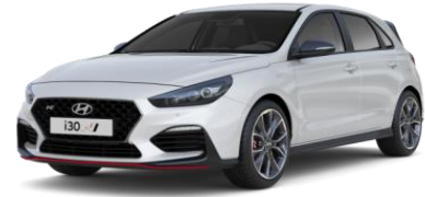
Polar White (PYW) perusväri