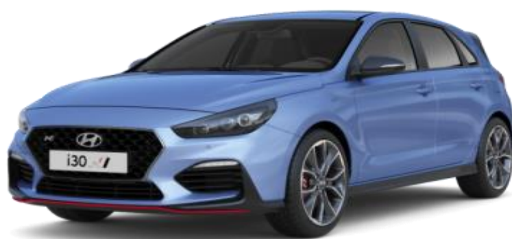
Performance Blue (XFB) erikoisväri