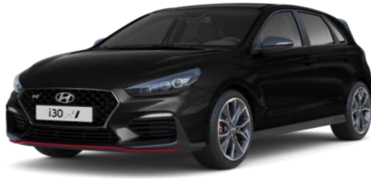
Phantom Black (PAE) helmiäisväri