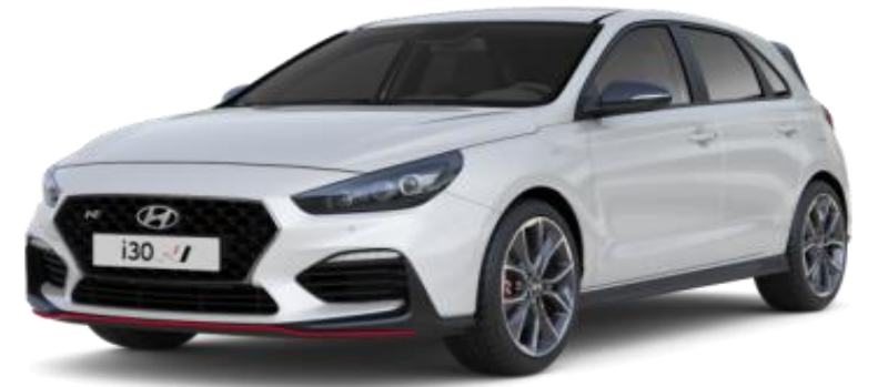
Polar White (PYW) perusväri