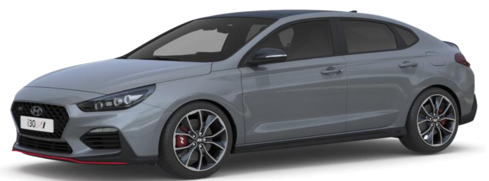
Shadow Grey (TKG) erikoisväri

Metalliväri tai erikoisväri (Autoveroton hinta 490 €, arvioitu autovero 194 € - 200 €) ovh sis. autoveron 684 € - 690 €