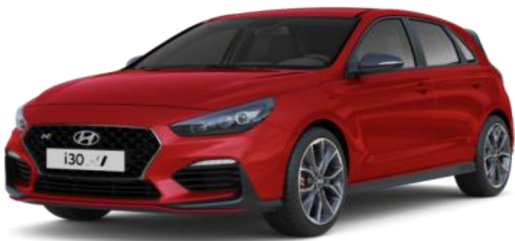
Engine Red (JHR) perusväri