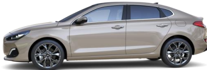
White Sand (Y3Y) metalliväri