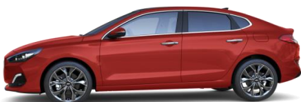
Engine Red (JHR) perusväri