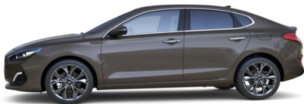
Moon Rock (XN3) metalliväri

Metalliväri tai helmiäisväri (Autoveroton hinta 490 €, arvioitu autovero 45 € - 86 €) ovh. 535 € - 576 €