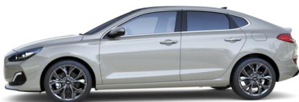
Platinum Silver (U3S) helmiäisväri