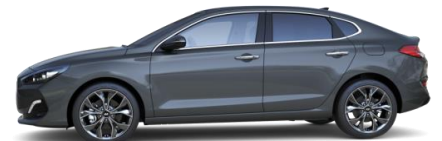
Micron Grey (Z3G) metalliväri