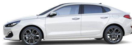
Polar White (PYW) perusväri