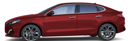
Fiery Red (PR2) metalliväri