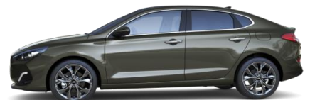
Olivine Grey (X5R) metalliväri