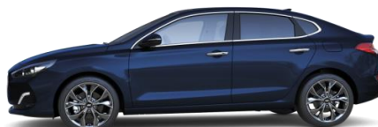
Stellar Blue (RWB) metalliväri