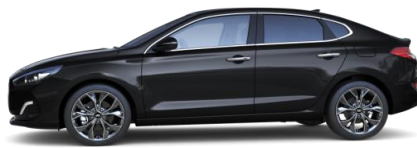
Phantom Black (PAE) helmiäisväri