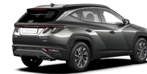
Amazon Gray/ Phantom Black -katto (A51)