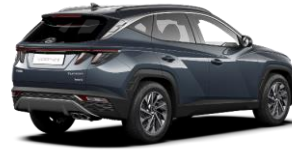
Teal/ Dark Knight -katto (TG1)