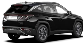
Phantom Black/ Dark Knight -katto (PA9)