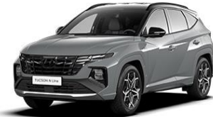
Shadow Gray (TKG) -erikoisväri (Saatavilla vain N Line -malliin)