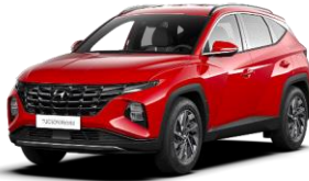
Engine Red (JHR) -vakioväri ilman lisähintaa