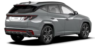
Shadow Gray/ Phantom Black -katto (TK1) (Saatavilla vain N Line -malliin)