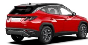
Engine Red/ Phantom Black -katto (JH1)