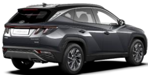
Dark Knight/ Phantom Black -katto (YG1)