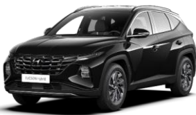
Phantom Black (PAE) -helmiäisväri