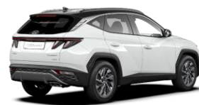
Serenity White (W6E) -helmiäisväri / Phantom Black -katto