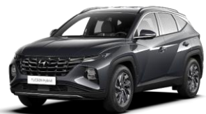
Dark Knight (YG7) -helmiäisväri