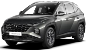
Amazon Gray (A5G) -metalliväri