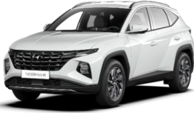
Atlas White (SAW) -erikoisväri

*** Phantom Black tai Dark Knight katto ovh 500 € + arvioitu autovero 19 € - 144 € = ovh 618 € - 743 € (Phantom Black ja Dark Knight kattovärit eivät saatavilla Comfort varustetason tai Panorama -lasikattoluukun yhteydessä.)