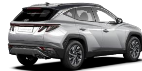
Shimmering Silver/ Dark Knight -katto (R2C)