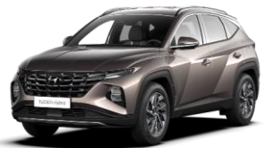
Silky Bronze (B6S) -metalliväri