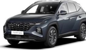
Teal (TG8) -metalliväri