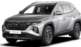
Shimmering Silver (R2T) -metalliväri