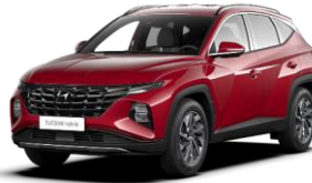
Sunset Red (WR6) -helmiäisväri