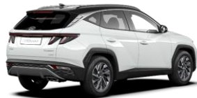
Atlas White (SAW) -erikoisväri / Phantom Black -katto (PY1)