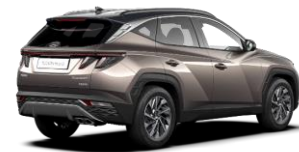
Silky Bronze/ Dark Knight -katto (B6C)