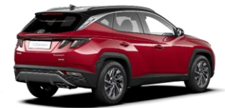
Sunset Red/ Phantom Black -katto (WRT)