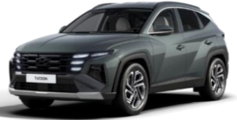
Cypress Green (T2P) Helmiäisväri Ei saatavilla N Line