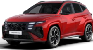
Ultimate Red (R1P) Helmiäisväri