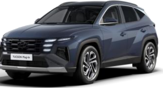
Sailing Blue (U2P) Metalliväri - Ei saatavilla N Line