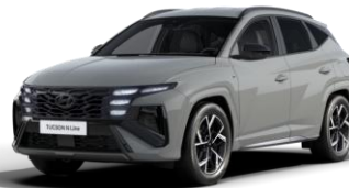
Shadow Gray (TKG) Erikoisväri - vain N Line