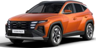
Jupiter Orange (PL2) Metalliväri - Ei saatavilla N Line