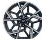
N Line 19" kevytmetallivanteet 235/50/R19 renkaat