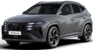
Ecotronic Grey (PE2) Helmiäisväri