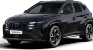
Abyss Black (A2B) Helmiäisväri