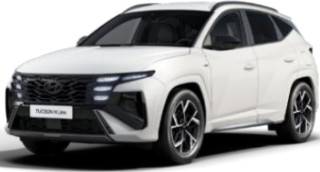
Atlas White (SAW) erikoisväri

(Musta kattoväri ei saatavilla Comfort-varustetason tai Panorama Sunroof -lasikattoluukun yhteydessä.)