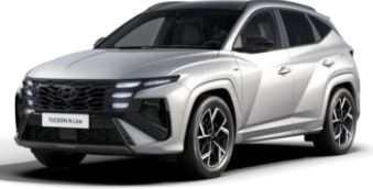
Shimmering Silver (R2T) Metalliväri