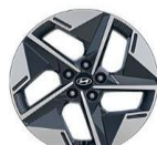
Style 18" kevytmetallivanteet, lisävaruste 235/55/R18 renkaat