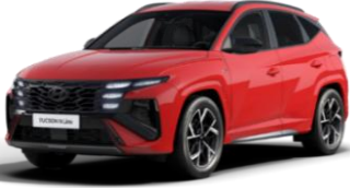
Engine Red (JHR) Veloitukseton väri